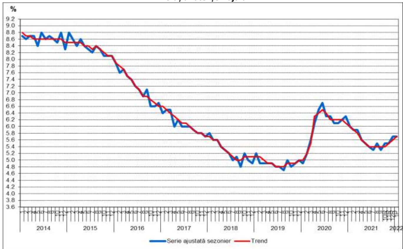
Evoluția ratei șomajului

R Date revizuite, P Date provizorii - conform politicii de revizuire a datelor (vezi punctul 6 din Precizări metodologice ).